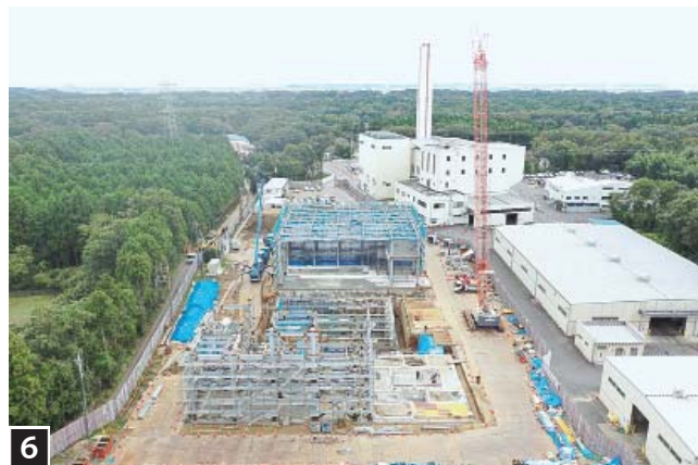
6 2020.10.28 管理棟：デッキコンクリート打設、ごみ ピット：躯体工事、炉室：鉄骨建て方