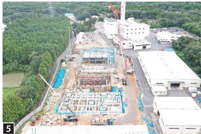
5 2020.9.29 管理棟：鉄骨建て方、ごみピット：地下 躯体工事、炉室：基礎工事