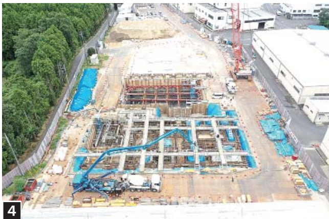
4 2020.8.31 管理棟：埋戻し、ごみピット：耐圧配筋、 炉室：基礎工事