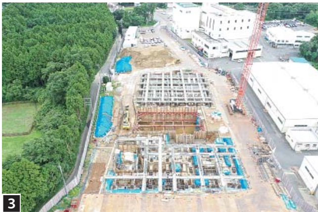
3 2020.7.29 管理棟：基礎工事、ごみピット：2次掘削、 炉室：基礎工事