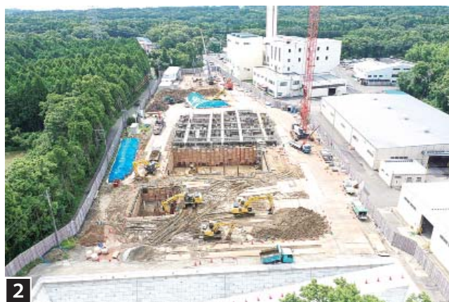
2 2020.6.29 管理棟：基礎工事、ごみピット：1次掘削、炉室：基礎掘削

地鎮祭を終え、今後は令和5年4月の竣工を目指して、本格的な建設工事が始まっております。地域の方々をはじめ、市村民の皆様には何かとご迷惑やご不便をおかけいたしますが、何卒、ご理解とご協力を賜りますようお願い申し上げます。