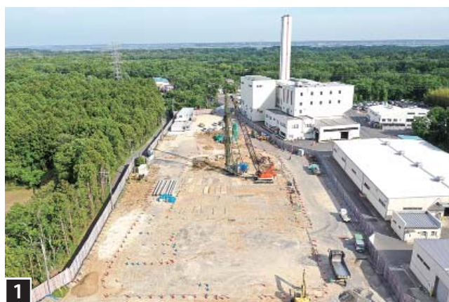
1 2020.5.14 杭工事

令和2年4月13日に建設工事敷地内において、施工業者主催の地鎮祭が行われ、市村関係者のほか、市村議会議員、地元区長、設計・施工業者などが出席し、工事の安全と無事を祈願しました。