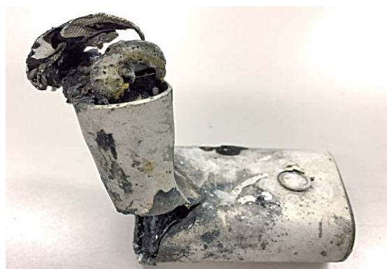
発火した加熱式タバコ