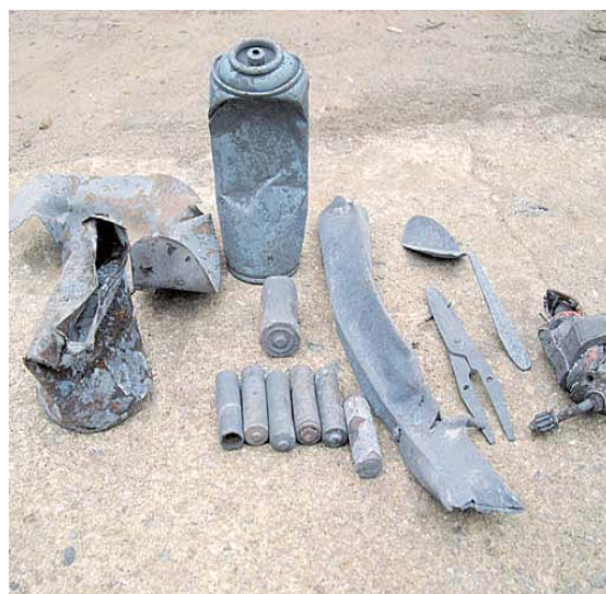
実際に燃やすごみに混入した金属類 (エアゾール缶、空き缶、乾電池など)

焼却炉に金属等が混入した場合、焼却炉の詰まりや損傷の原因となります。施設を損傷した場合には、長期停止し多額の費用をかけての修理を行わなくてはなりませんので金属類は分けて出して下さい。